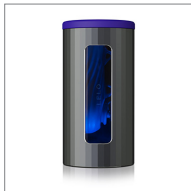
Gunmetal / Midnight Blue