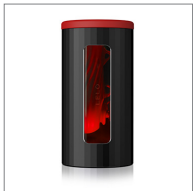
Black / Red